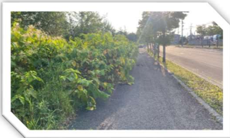
草刈り前（ローソン歩道）

ローソンへ行く歩道部分、タワー周辺について雑草が生い茂ってきており、物騒・歩行に支障など報告があり町内会から管理者へ草刈りの要請を予定。（役員会後 確認の結果 ローソン側はすでに草刈りが実施済みでした）