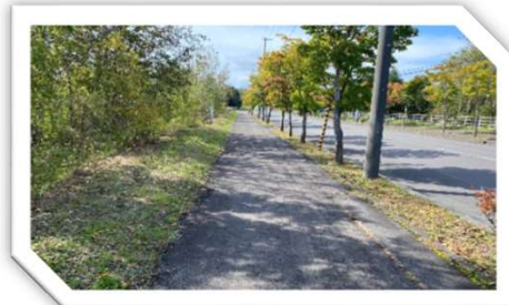
草刈り後（ローソン歩道）